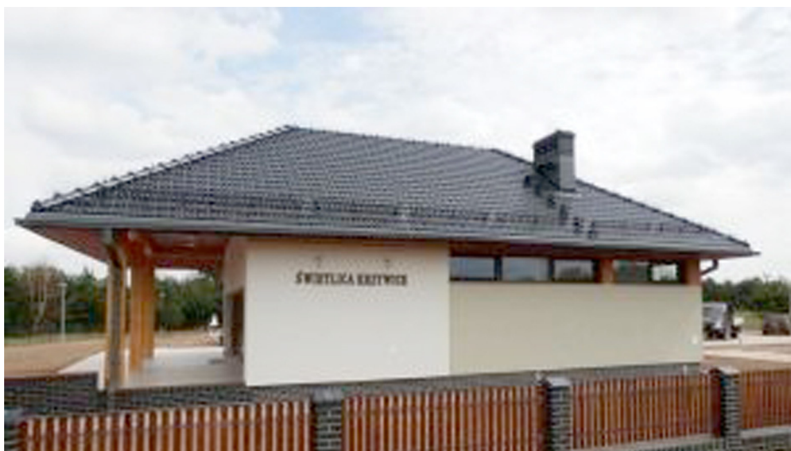
Swietlica w Krzywicach, gmina Osina, wybudowana z funduszy PROW

projektów rewitalizacyjnych RPO WZ na najbliższe lata. Obecnie wsparcie będzie udzielane m. in. w trybie działania 9.3 RPOWZ