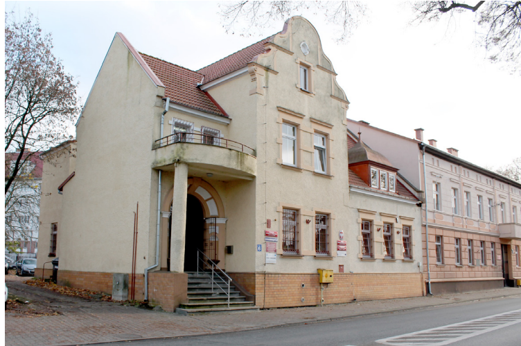
Ośrodek Pomocy Społecznej w Nowogardzie

Staż (bon stażowy) , najbardziej popularna forma aktywizacji zawodowej. Oferta ta jest skierowana jest głównie do osób, które nie przekroczyły 30 roku życia, choć pojawia się także staże dla osób starszych, finansowane z Funduszu Pracy. Przyznanie takiego Bonu Stażowego gwarantuje skierowanie na maksymalnie półroczny staż u wybranego