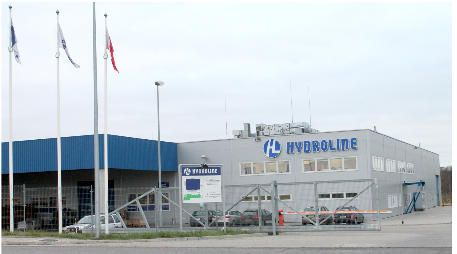
Firma Hydrolina ze Stargardu otrzymała dofinansowanie w ramach 1.5 na wprowadzenie innowacyjnej technologii

Na wsparcie, w tym działaniu, mogą liczyć projekty, które przyczyniają się do zwiększenia zastosowania innowacji w sektorze MŚP i wzmacniają inteligentne specjalizacje Pomorza Zachodniego. Szczegóły zawiera regulamin, dostępny na stronie www.rpo.wzp.pl . Beneficjentami są tu przedsiębiorstwa z sektora MŚP, a do dofinansowania można zgłaszać inwestycje w grunty, budynki, budowle, nowoczesne maszyny i urządzenia, linie produkcyjne, wartości niematerialne i prawne, czy wdrażanie nowych rozwiązań technologicznych, których rezultatem jest wykreowanie nowego lub zasadniczo ulepszanego produktu czy usługi. Kwota przeznaczona w aktualnie trwającym konkursie to 52 640 000,00 zł. Nabór trwa od 01.12.2016 do 31.01.2017. To konkurs, który cieszy się dużym zainteresowaniem przedsiębiorców. Umożliwia on realizację inwestycji na dużą skalę. Wszystko dzięki relatywnie wysokim